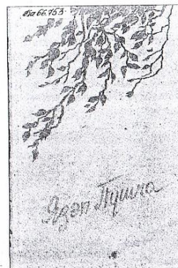
«Вершы і паэмы», 1960 г.

Язэп Пушча паспеў надрукаваць верш «Узмахі» («Польмя», № 2) і паэмы «Крывавы плакат», «Сады вятроў» («Узвышша», № 3). З той пары імя Язэпа Пушчы не траплялася на кніжных паліцах і старонках перыядычных выданняў БССР да 1956 года (у Заходняй Беларусі у 1935 і 1939 гадах яго творы публікавалі ў часопісе «Калоссе»).