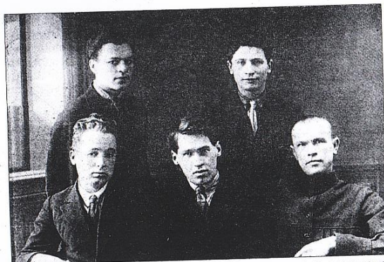
Рэдкалегія часопіса «Узвышша», 1927 г.